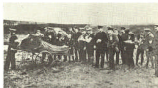
Links: Prüfungsbekräftigung für ein Mitglied des Proletarischen Gesundheitsdienstes in Jena 1923/24 Rechts: Einsatz der Lehrlinge des ASB in Leipzig zur Cholera im März 1906