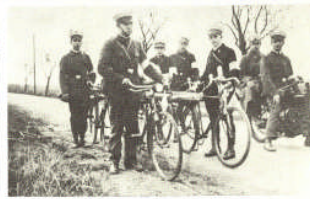
Oben: Ein Arbeiter-Samariter von Fehrbellin im Jahre 1920 Unten: Fahrradtag mit mehreren Tausenden Vereinen, März 1926 in Leipzig