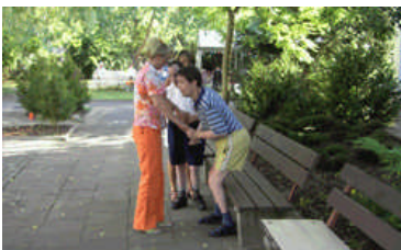
Außenanlage des Wohnheimes

Kathrin Damm Rathenaustraße 2 06231 Bad Dürrenberg Telefon: 03462 / 99 1-0