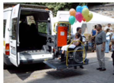
Unser Fahrdienst in Aktion

Rolf Beyer Weiße Mauer 20 06217 Merseburg Telefon: 03461 / 30 95 62