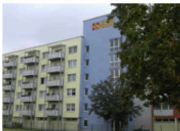
Außenansicht Betreutes Wohnen